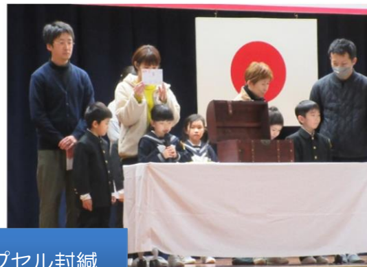
タイムカプセル封緘