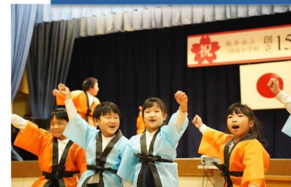
さあ！おいわいだ！みんなでおどろう！